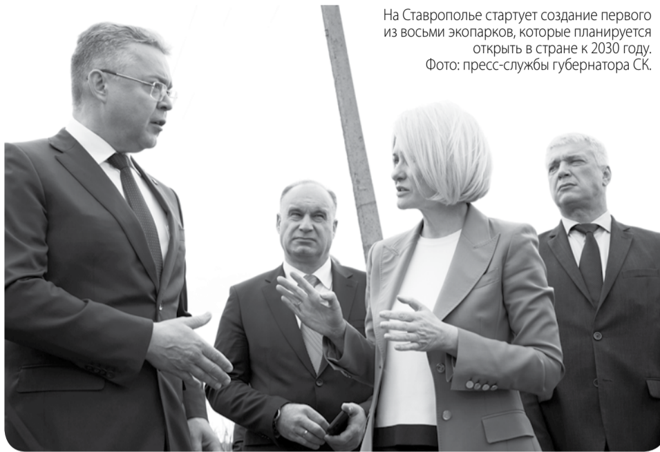
На Ставрополье стартует создание первого из восьми экопарков, которые планируется открыть в стране к 2030 году.

Также вице-премьер высоко оценила готовность края к дальнейшему повышению качества управления природными ресурсами, в связи с чем рассматривается возможность включения Ставрополья в пилотный проект создания единого феде-