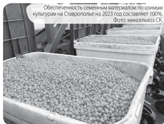
Обеспеченность семенным материалом по озимым культурам на Ставрополье на 2023 год составляет 100%.

– Этот вопрос мы отрабатываем совместно с научно-исследовательскими институтами и семеноводческими хозяйствами, действующими в России и Ставропольском крае. Агропредприятия уже закладывают площади под семена кукурузы, подсолнечника, сахарной свёклы, мощностей которых достаточно, чтобы обеспечить в полной мере потребности наших сельхозтоваропроиз-